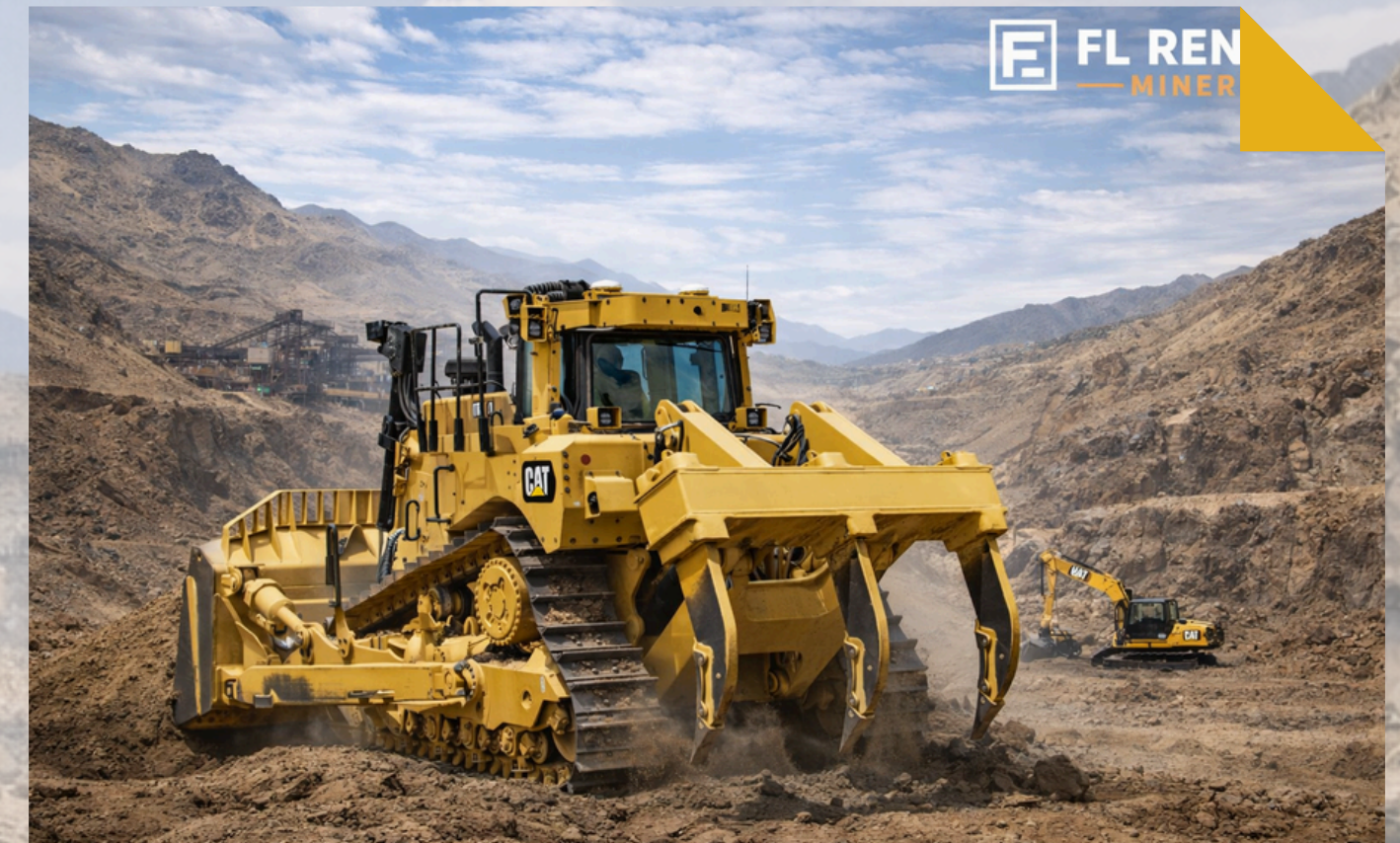
BULLDOZER CAT Modelos: D8 - D9 - D11