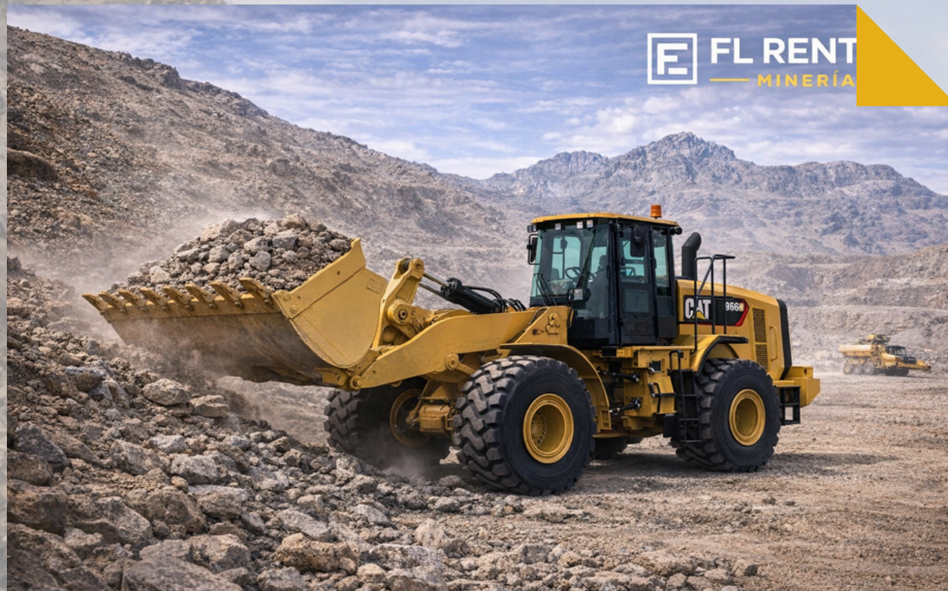
CARGADOR FRONTAL Modelo CAT 966 GC