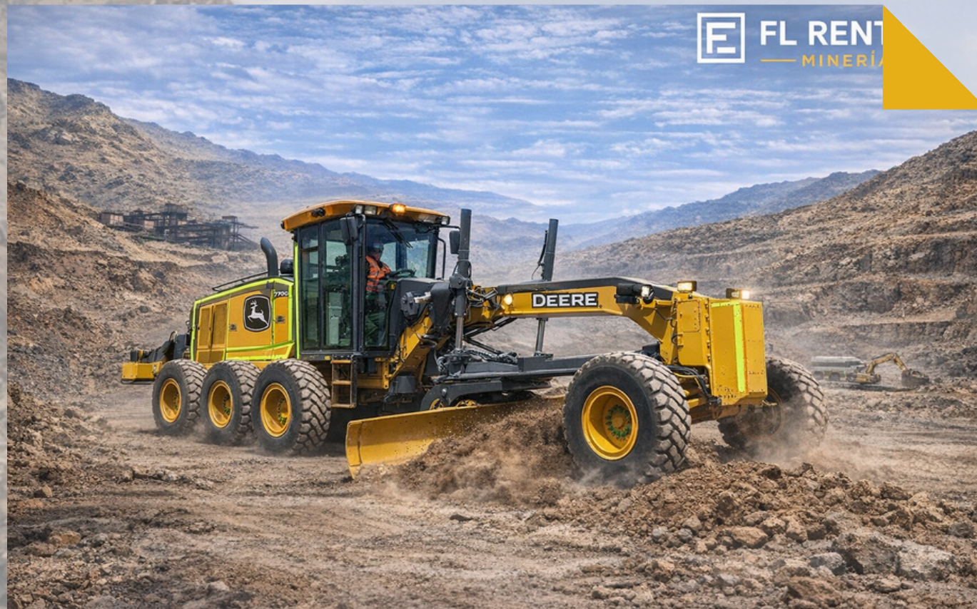
MOTONIVELADORA John Deere 770G - 620G - 670G