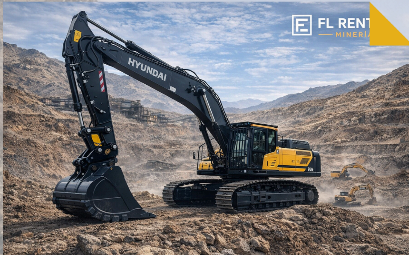
EXCAVADORAS HYUNDAI Modelos: HX520 - HX340