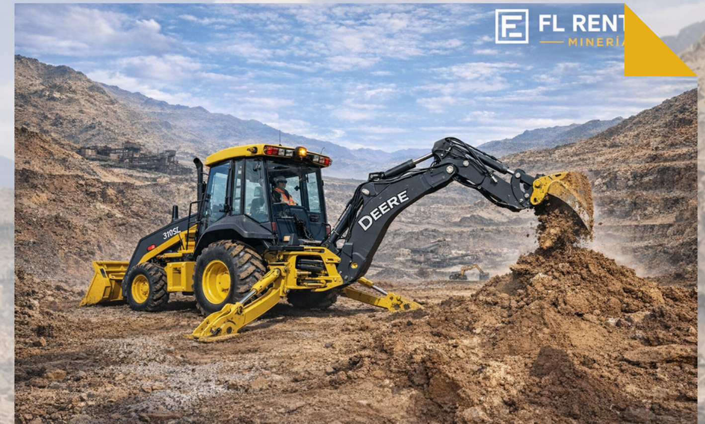
RETROEXCAVADORA JOHN DEERE Modelo: 310L