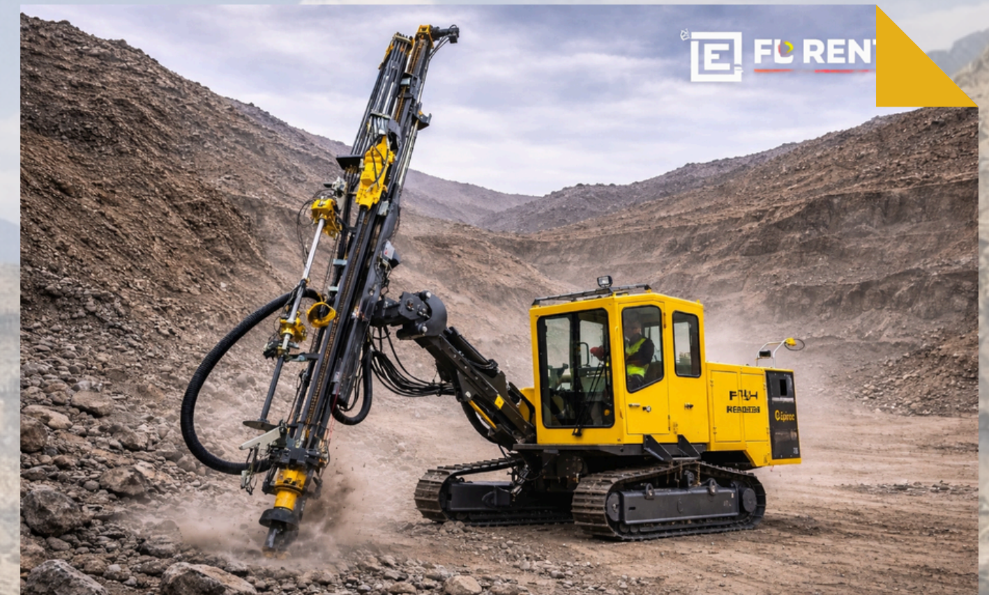
PERFORADORA Epiroc PowerROC T25 DC 2023