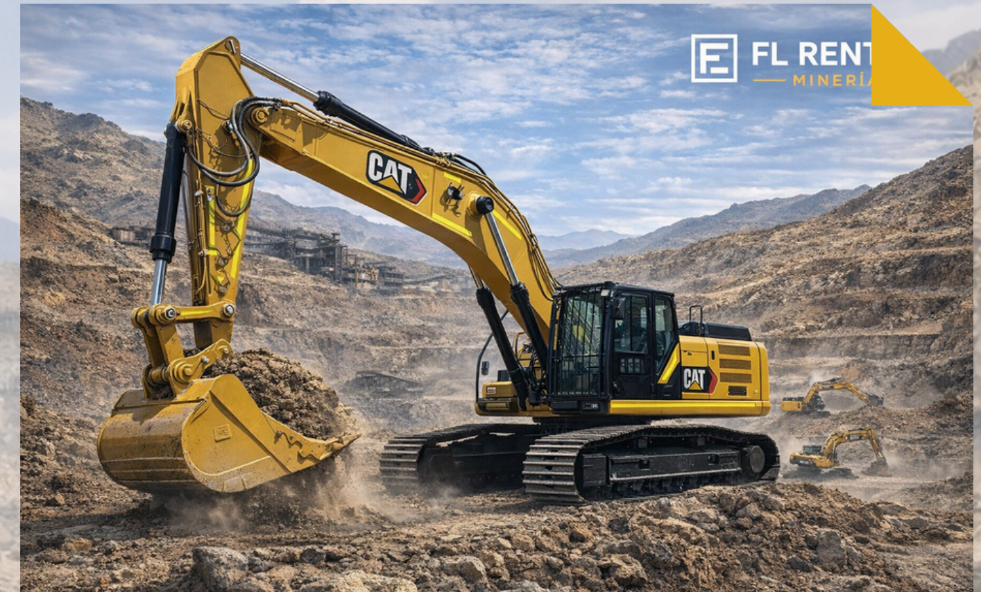
EXCAVADORAS CATERPILLAR Modelos: 320 - 330