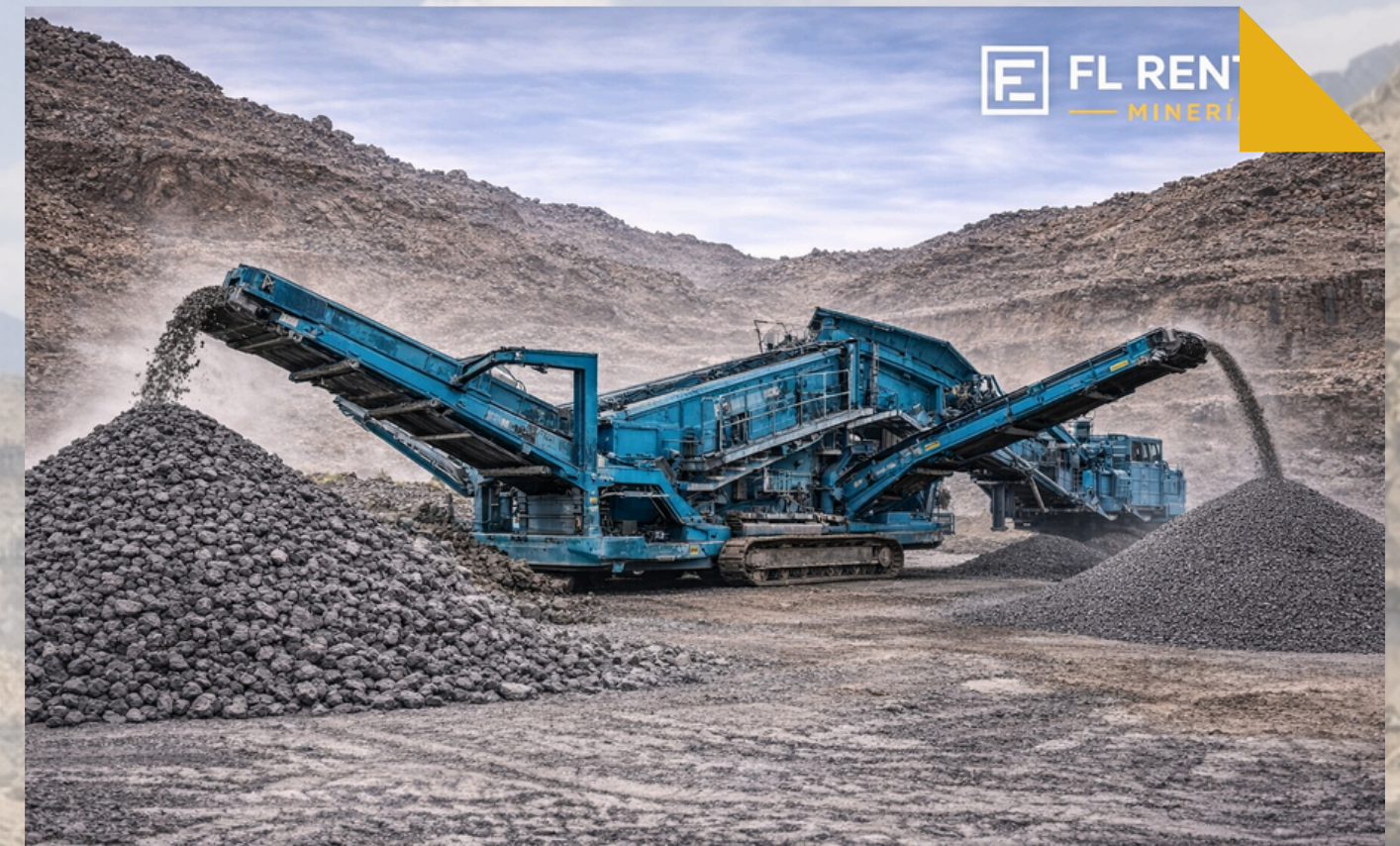
PLANTA SELECCIONADORA The Powerscreen Warrior 1800