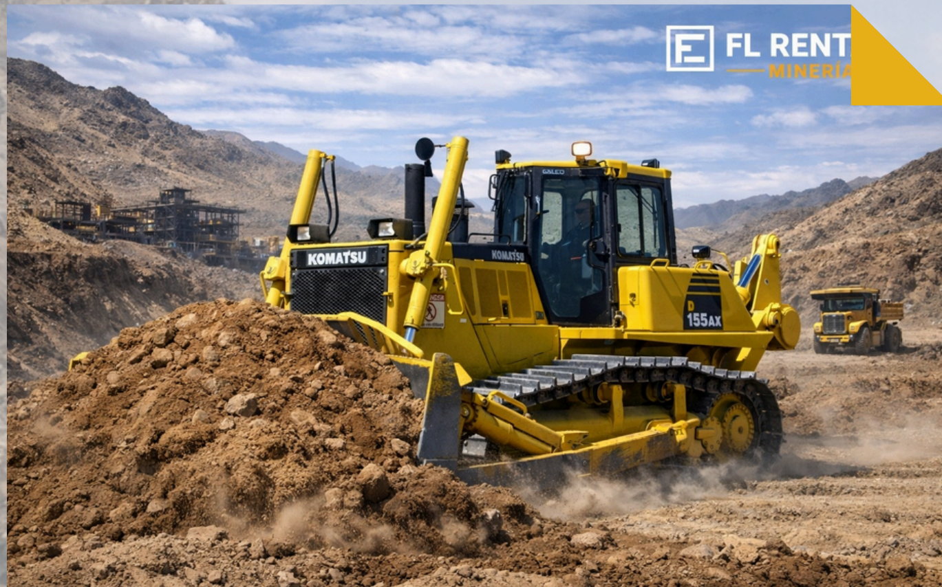
BULLDOZER Modelos: D155AX