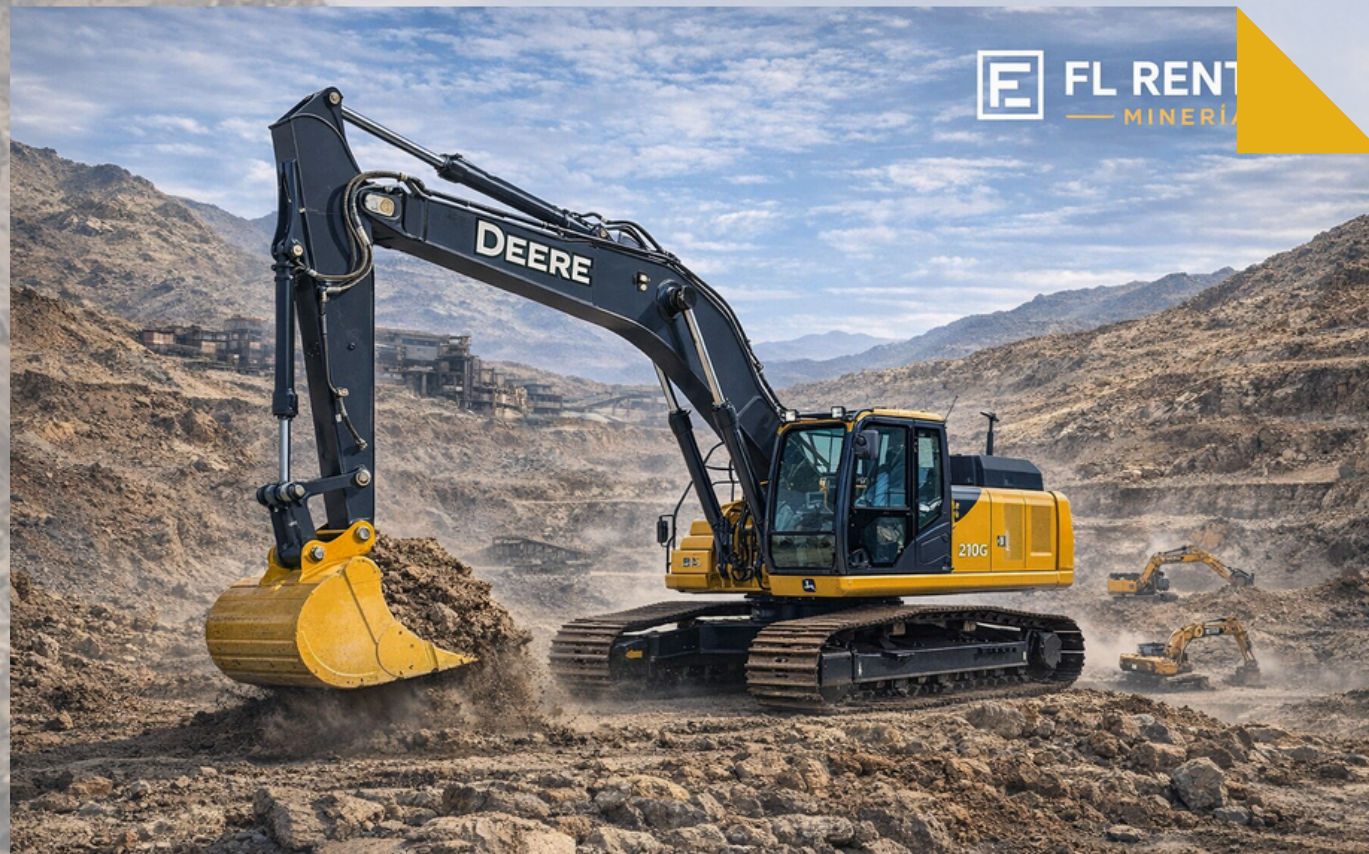
EXCAVADORAS JOHN DEERE Modelos: 210G LC - 300P - 350G LC