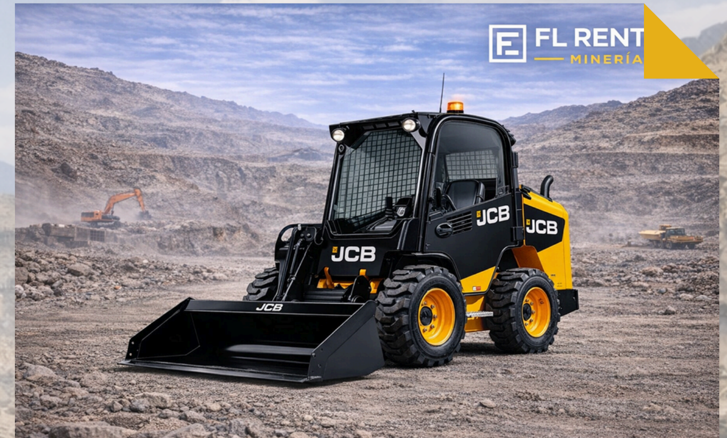
MINI CARGADOR JCB Modelo: 270