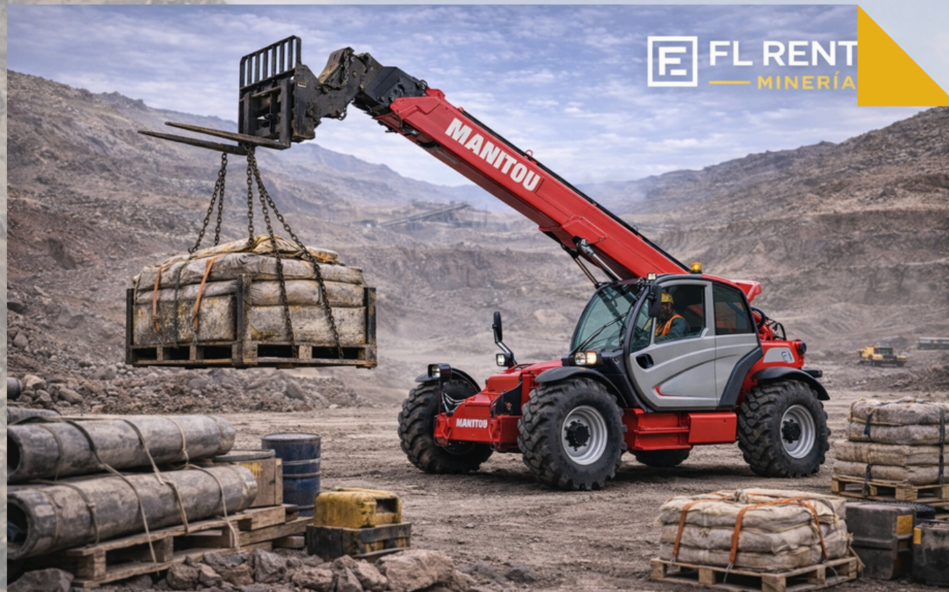
MANIPULADOR TELESCOPICO Modelo

Nuestra flota de maquinarias está compuesta por equipos estandarizados y configurados según los requerimientos de faena, con programas de mantenimiento preventivo, control de condición, certificaciones vigentes y cumplimiento de exigencias HSE. Cada unidad cuenta con inspecciones operacionales y respaldo técnico, asegurando alta disponibilidad mecánica, confiabilidad y continuidad operacional en proyectos mineros y de movimiento de tierra.