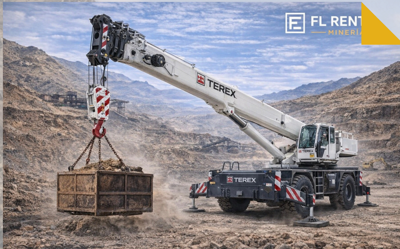
GRUAS RT Modelos: RT1000 - RTX780